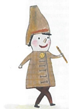
Lesní skřítek Flautík má přišitý knoflík.